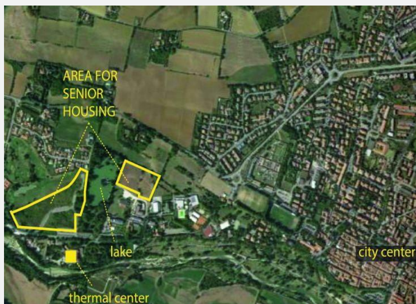
Localizzazione area su Google map