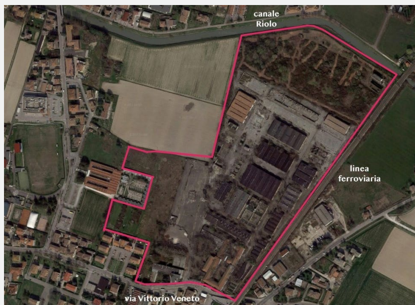
L'area su Google map