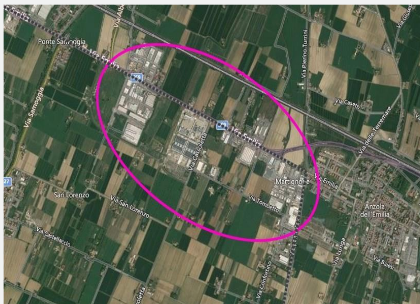
Localizzazione area su Google map

Ad oggi, sono 175 le imprese già insediate, circa metà appartenenti al settore manifatturiero, tra le quali si segnalano aziende del settore metalmeccanico. In particolare, sono insediate nell'ambito di Martignone due fra le più importanti aziende leader della Packaging Valley bolognese.